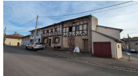
Maison à Pan de Bois