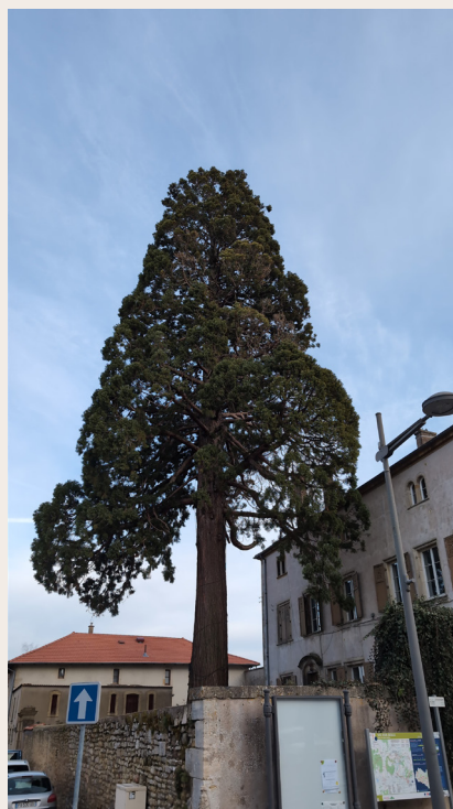
Séquoia de Vic sur Seille