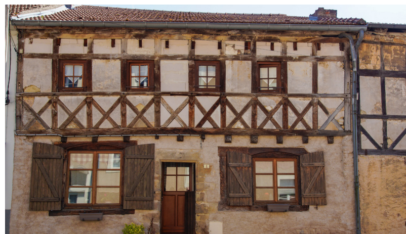
Maison à Pan de Bois

RFN0002 - Le nom Randofiche® est une marque déposée, nul ne peut l'utiliser sans l'autorisation de la Fédération française de la randonnée pédestre. © FFRandonnée 2025. FFRandonnée