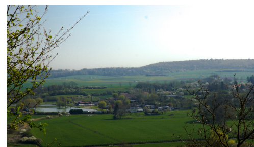
Vue sur Vic-sur-Seille