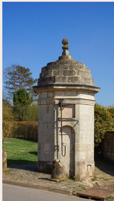
La Bonne Fontaine-Vic-sur-Seille

surmontées de cavités carrées. il est terminé par une corniche supportant un toit constitué de quatre octogones peu épais, de taille décroissante, et sommé d'un pot à feu. L'une des faces comporte un bras permettant d'activer le pompage. La face voisine est munie d'une porte métallique permettant l'accès au mécanisme. Le dégorgeoir est situé au-dessus d'une rigole amenant l'eau à l'égout. Autrefois, l'eau était dirigée vers un bassin situé sous l'arche du mur voisin et permettait l'écoulement du trop-plein de la fontaine. L'édifice est installé sur un pavage délimité par des bornes chasse roues.