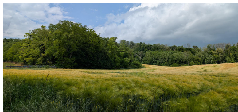
Les blés à Vic sur Seille