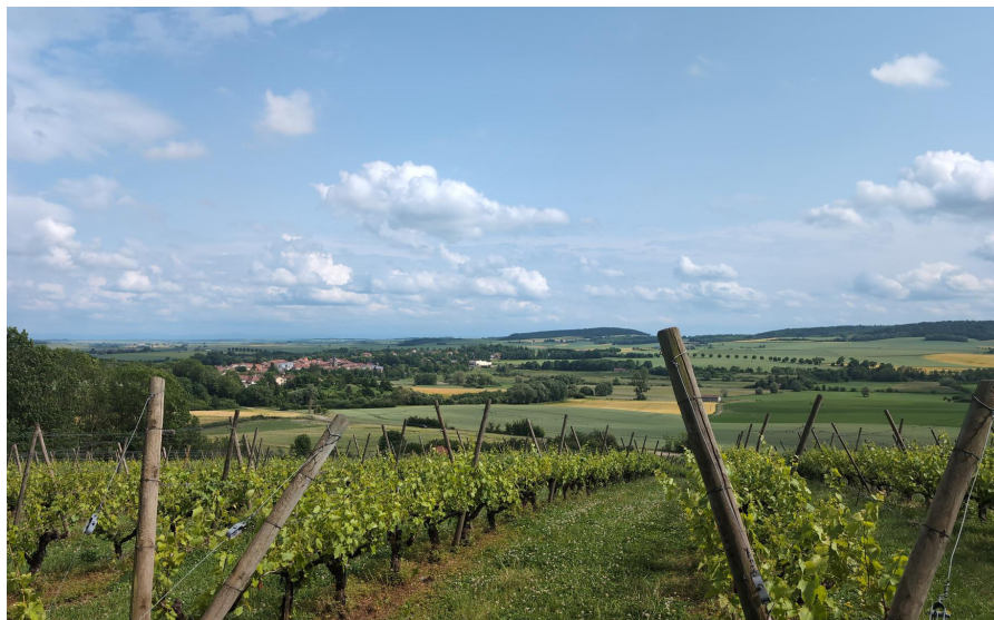
Vigne à Vic-sur-Seille