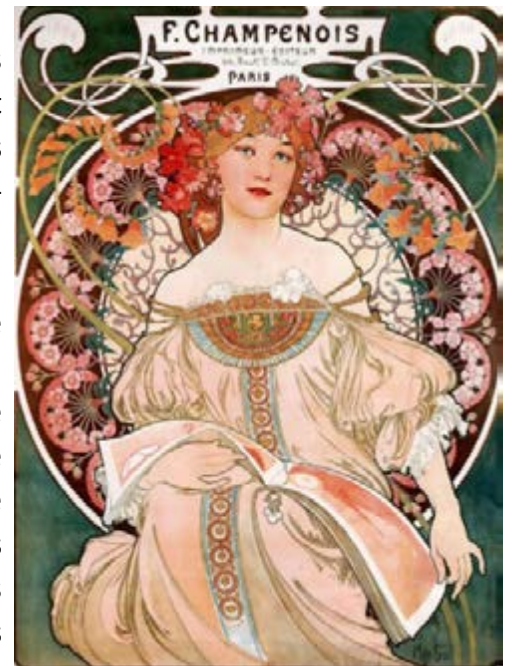
Affiche Champenois Imprimeur-Editeur, 1897, crédit photo Art Renewal Center Museum

Nous ne pouvons pas parler d'Art nouveau sans parler de la ville de Nancy. En effet, Nancy est la capitale française de l'Art nouveau. A partir de 1871, en réaction à l'annexion, beaucoup de français artistes mais aussi industriels venus de régions devenues allemandes se dirigent vers Nancy et se mêlent aux artistes nancéens. Un groupe de personnalités et d'artistes bien connus aujourd'hui (Louis Majorelle, Emile Gallé, les frères Daum etc.) vont créer en 1901 « l'Alliance provinciale des industries d'Art » plus connue sous le nom d'Ecole de Nancy. Ces artistes mais aussi des industriels veulent mettre l'art à portée de tous et partout.