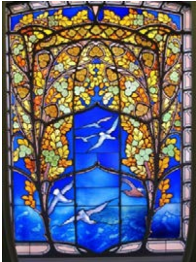
Figure 1 Vitrail des "Roses et des mouettes", 1904, Maison Bergeret, Nancy

C'est pour cela que les supports sont très variés : architecture, mobilier, vitraux etc. La nature est encore une fois leur inspiration. Jacques Grüber qui est un maître verrier français et qui fait partie de l'École de Nancy a produit des vitraux magnifiques qui invitent à la contemplation et à la rêverie ( photo ). Nous pouvons également parler de Louis Majorelle, ébéniste et décorateur français qui a créé du mobilier magnifique agrémenté de motifs floraux très détaillés. Ses objets peu communs offrent des intérieurs de maisons très singuliers ( photo ). L'École de Nancy a eu un grand retentissement en Europe et fait écho aux mouvements Art nouveau présents dans les autres villes. Le musée actuel de l'École de Nancy contribue également à la renommée de la ville.