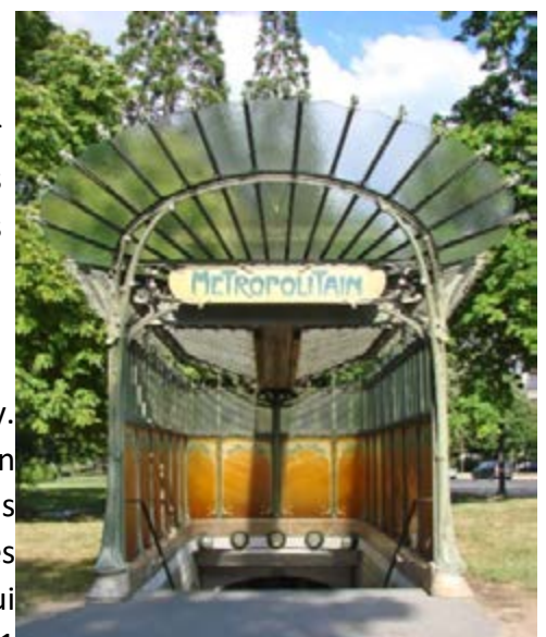
Entrée de bouche de métro à Paris, Hector Guimard