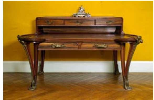
Figure 2 Bureau Nénuphars, 1900, Louis Majorelle, Musée de l'Ecole de Nancy

C'est pour cela que les supports sont très variés : architecture, mobilier, vitraux etc. La nature est encore une fois leur inspiration. Jacques Grüber qui est un maître verrier français et qui fait partie de l'École de Nancy a produit des vitraux magnifiques qui invitent à la contemplation et à la rêverie ( photo ). Nous pouvons également parler de Louis Majorelle, ébéniste et décorateur français qui a créé du mobilier magnifique agrémenté de motifs floraux très détaillés. Ses objets peu communs offrent des intérieurs de maisons très singuliers ( photo ). L'École de Nancy a eu un grand retentissement en Europe et fait écho aux mouvements Art nouveau présents dans les autres villes. Le musée actuel de l'École de Nancy contribue également à la renommée de la ville.